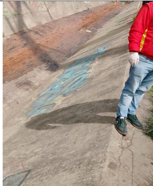
Después de la limpieza Canal Los Comuneros

Nota: Agregue o elimine las filas que sean necesarias para registrar los asistentes y los compromisos de la reunión.