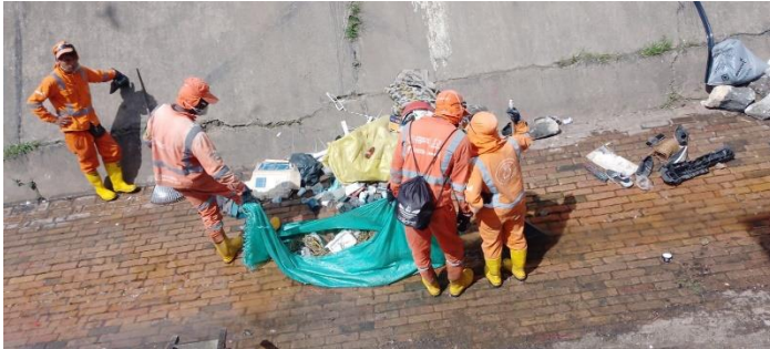
Operadores de Limpieza