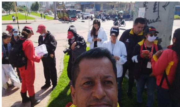
Calle 6 con Carrera 24 (Canal Los Comuneros)

Siendo las 09:20 horas, nos dirigimos a la Calle 6 con Carrera 24 (Canal Los Comuneros) donde se encontraban las demás entidades como lo fueron, Secretaria de Gobierno, UAESP, DADEP, Alcaldía Local Puente Aranda, Policía Nacional, Secretaria Distrital de Integración Social, Aguas de Bogotá, Secretaria de Salud, IDIGER, Operador de aseo, Gestor de Transmilenio, Secretaria de Seguridad.