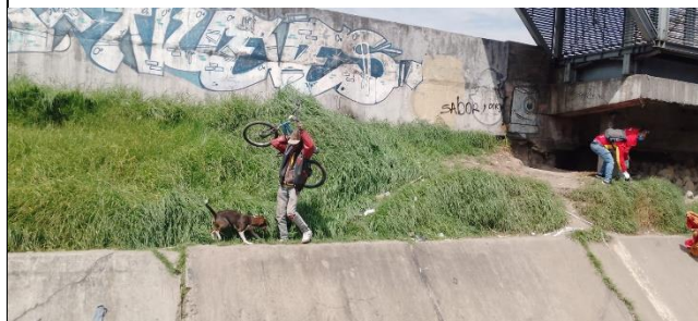
Habitante de calle con su mascota