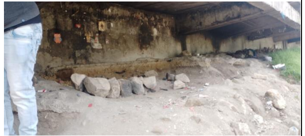
Limpieza del sitio

La jornada de limpieza se llevo a cabo desde la Calle 6 con Carrera 24 hasta la Carrera 27, no se pudo intervenir más allá ya que las entidades comprometidas con el operativo no dieron o llevaron herramientas necesarias para dar con finalidad total el operativo como se tenía previsto.