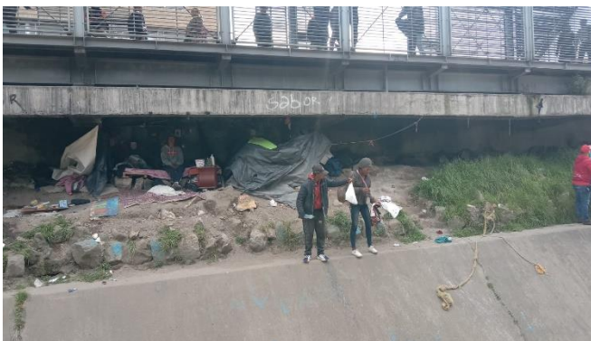
Cambuche y personas de calle